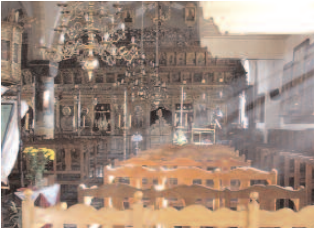
Ο ναός έχει δύο Άγιες Τράπεζες. Η μία, αφιερωμένη στην Παναγία, ανήκε στον παλιό ναό δίπλα από τον οποίο προστέθηκε ο νεότερος και μεγαλύτερος. Σήμερα, χρησιμοποιείται μόνο η Αγία Τράπεζα του Αγίου Κασσιανού.